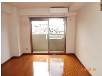
※室内写真は303号室となります。