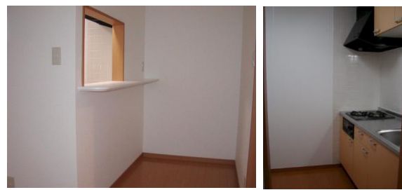
※室内写真は2号室タイプ

102号室 退去予定 家賃: 55,000円 管理費: 3,000円 メンテ保証料: 600円 (緊急修理含む) (9/末退去予定・10/末入居可予定) 使用部分面積: 33.69㎡