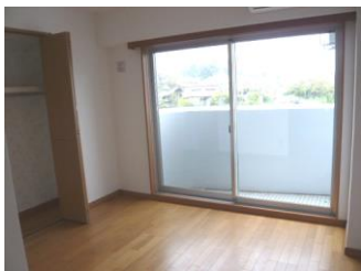
※室内写真は3号室の為、反転となります。