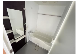
※室内写真は301号室となります。