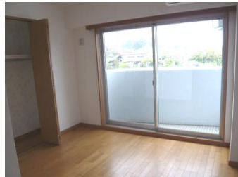
※室内写真は3号室となります。