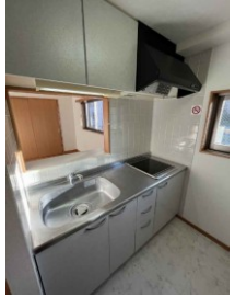
※室内写真は201号室となります。