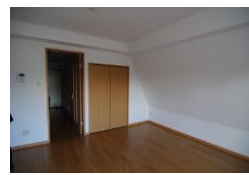
※室内写真は403号室となります。