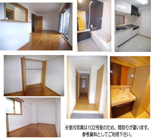
※室内写真は102号室のため、間取りが違います。参考資料としてご利用下さい。

107号室 退去予定 家賃：66,000円 管理費：4,000円 メンテ保証料：600円 (緊急修理含む) (10/末退去予定・11/末入居可予定) 使用部分面積：61.30㎡