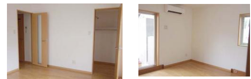
※室内写真は101号室となります。(キッチンは201号室)

101号室 退去済 家賃：55,000円 管理費：4,000円 償却負担金：880円 (即入居可) 使用部分面積：27.21㎡