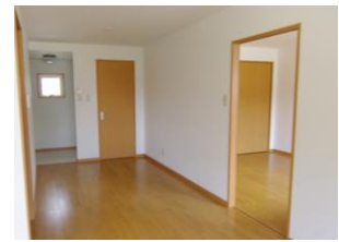
※室内写真は、201号室となります。

※退去・入居時期はあくまで予定となります。 変更となる場合がございます事、予めご了承ください。