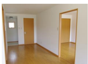
※室内写真は、201号室となります。

※退去・入居時期はあくまで予定となります。 変更となる場合がございます事、予めご了承願います。