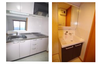
※室内写真は602号室となります。