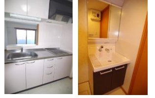
※室内写真は602号室となります。