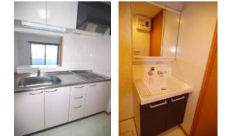
※室内写真は602号室となります。

※退去・入居時期はあくまで予定となります。 変更となる場合がございます事、予めご了承願います。