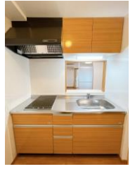
※室内写真は101号室となります。