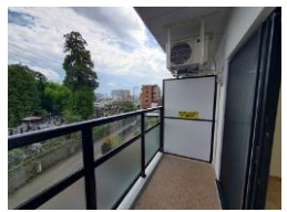
※室内写真は303号室となります。

Point ・給湯はガスで湯切れの心配ナシ ・コンロはIHでお手入れラクラク ・宅配ボックス完備で ネットショッピングも安心 ・照明器具・カーテンの準備不要