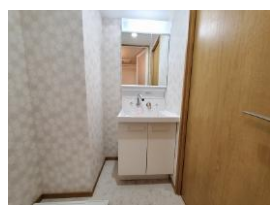
※室内写真は403号室となります。

403号室 退去済 賃料 55,000円 管理費 4,000円 緊急メンテ費 700円 (即入居可) 使用部分面積: 26.77㎡