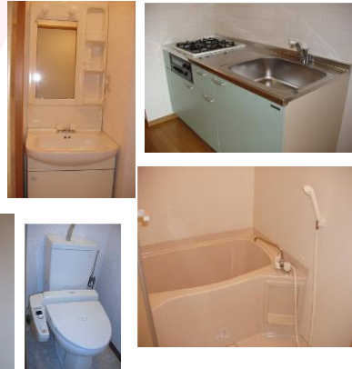
※室内写真は、1号室となります。