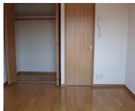
※室内写真は、1号室となります。