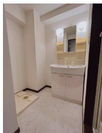
※室内写真は202号室となります。