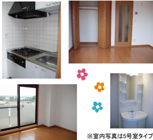
※室内写真は5号室タイプ