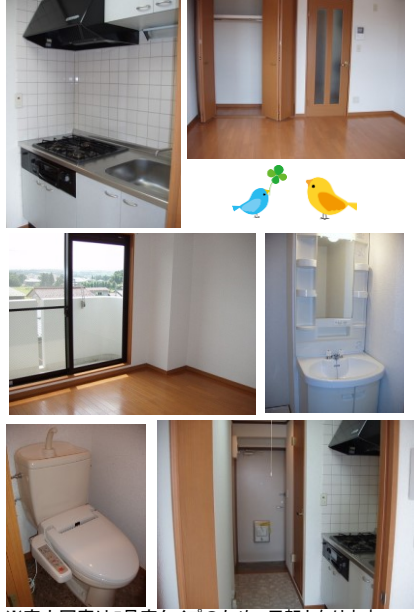
※室内写真は5号室タイプのため、反転となります。

(社)宮城県宅地建物取引業協会会員/東北地区不動産公正取引協議会加盟 / (公社)全国宅地建物取引業保証協会会員 宮城県知事 (5) 第4847号 仙台市宮城野区自由ヶ丘13-11 TEL 022-252-7106 FAX 022-252-9286 http://www.nipponhome.co.jp