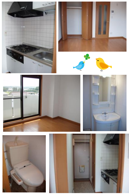
※室内写真は5号室タイプ

今回募集 305号室 退去済 賃料 48,000円 管理費 2,500円 (即入居可) 使用部分面積 : 24.48㎡