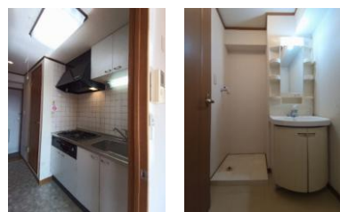
※室内写真は305号室となります。

今回募集 305号室 退去済 賃料 47,000円 管理費 2,500円 (即入居可)