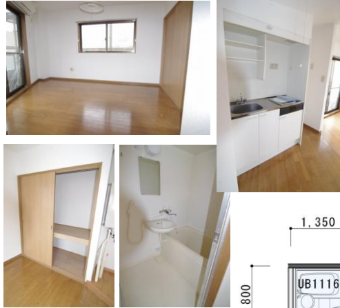
※室内写真は302号室となります。

302号室 退去予定 家賃：43,000円 管理費：2,500円 メンテ保証料：600円 (緊急修理含む) (7/末退去予定・8/中旬入居可予定) 1Rタイプ 使用部分面積：21.32㎡