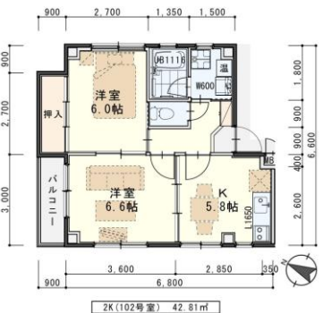
※図面と現況が異なる場合は現況を優先します

※ペット飼育の場合は敷金2ヶ月・礼金1ヶ月となります。 償却負担金も発生いたします。