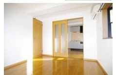
※室内写真は302号室となります。