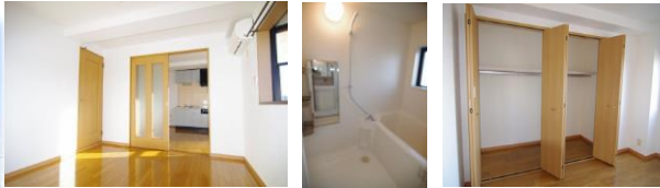
※室内写真は302号室の為相違あり。参考資料としてご利用下さい。