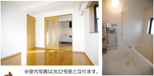
※室内写真は302号室となります。

※退去・入居時期はあくまで予定となります。 変更となる場合がございます事、予めご了承願います。