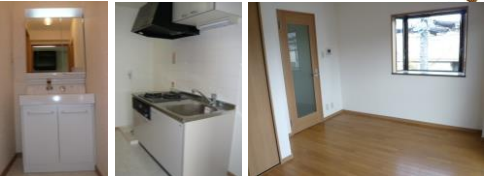
※室内写真は1号室となります。

※個人契約でペットを飼育の場合は敷金2ヶ月となります。 (メンテ保証料も発生いたします) ※法人契約の場合は、敷金2ヶ月となります。 ※ペット飼育時は家具家電セットはできません