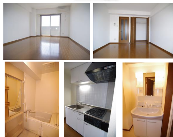
※室内写真は303号室のため反転となります。

○今回募集○ 302号室 家賃 47,000円 管理費 3,000円 メンテ保証料 600円 (緊急修理含む) (10/未退去予定・11/未入居可予定) 使用部分面積 26.24㎡