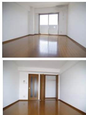
※室内写真は303号室のため反転となります。