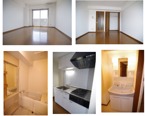
※室内写真は303号室となります。

今回募集 403号室 退去済 家賃 47,000円 管理費 3,000円 メンテ保証料 600円 (緊急メンテ含む) (即入居可) 使用部分面積 26.24㎡