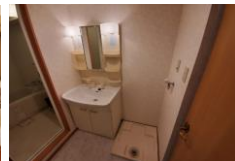
※室内写真は102号室となります。