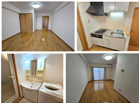
※室内写真は305号室となります。