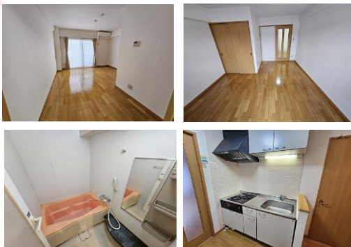
※室内写真は205号室となります。