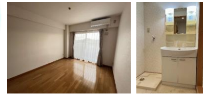
※室内写真は203号室のため反転となります。