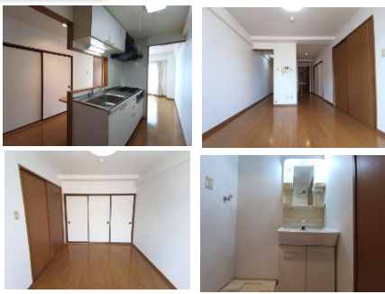
※室内写真は106号室となります。

206号室 退去予定 家賃：70,000円 管理費：4,000円 緊急メンテ費：700円 (6/末退去予定・7/中旬入居可予定) 使用部分面積:61.60㎡