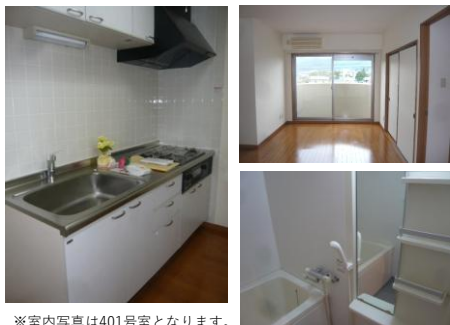
※室内写真は401号室となります。

401号室 退去予定 家賃：75,000円 管理費：4,000円 緊急メンテ費：700円 (7/末退去予定・8/中旬入居可予定) 使用部分面積:67.12㎡