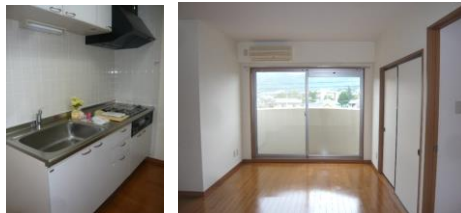
※室内写真は401号室となります。