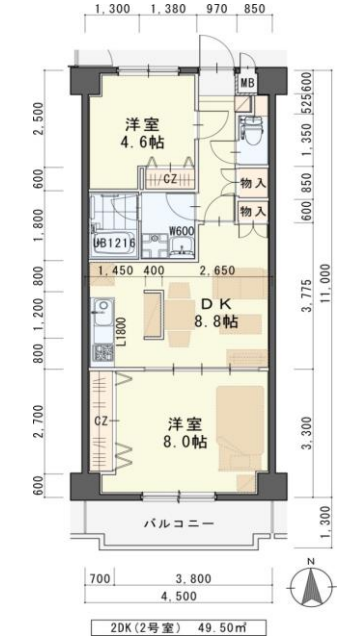
※現況と図面が異なる場合は現況有姿を優先します。

★敷金0ヶ月★保証料0円 ★家具家電リース料0円 さらに! 家具家電付でも家賃管理費そのまんま!! ※法人契約の場合は、敷金2ヶ月となり ダブルゼロ となります。