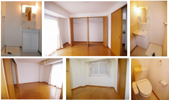
※室内写真は502号室となります。

※退去・入居時期はあくまで予定となります。 変更となる場合がございます事、予めご了承承ります。