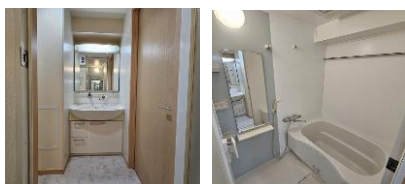
※室内写真は203号室となります。