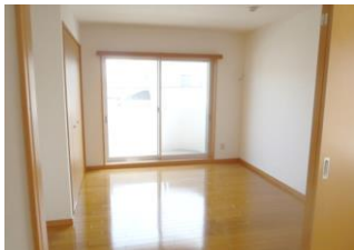
※室内写真は3号室タイプ