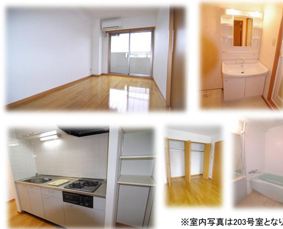
※室内写真は203号室となります。

203号室 退去済 家賃:63,000円 管理費:3,000円 償却負担金:880円 (即入居可) 使用部分面積:42.30㎡