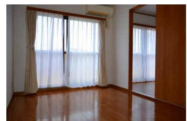
※室内写真は103号室となります。

※ペット飼育時は家具家電セットはできません 103号室 退去済 家賃 51,000円 管理費 3,000円 緊急メンテ費 700円 (即入居可)