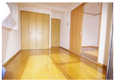
※室内写真は106号室となります。

今回募集のお部屋 106号室 退去済 家賃 53,000円 管理費 3,000円 緊急メンテ費 100円 即入居可