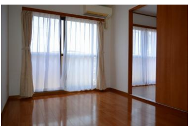
※室内写真は103号室となります。

203号室 退去予定 家賃 53,000円 管理費 4,000円 緊急メンテ費 700円