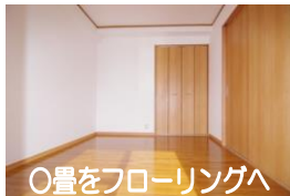
○畳をフローリングへ