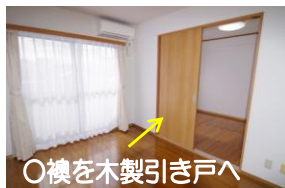
○換を木製引き戸へ