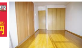
※室内写真は105号室となります。