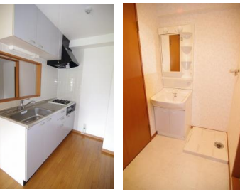
※室内写真は402号室となります。