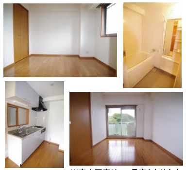
※室内写真は402号室となります。

605号室 退去済 家賃: 69,000円 管理費: 4,000円 メンテ保証料: 600円 (緊急メンテ含む) (リフォーム中・7/末入居可予定) 使用部分面積: 57.24㎡