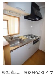
※写真は、302号室タイプ

【室内リニューアル】 リフォーム内容 ~2020年3月リフォーム完了~ ・フローリング全面貼り替え ・洗面化粧台シャブードレッサーへ交換 ・浴室サーモスタッド水栓へ交換 ・キッチン収納扉交換・壁クロス全面貼り替え