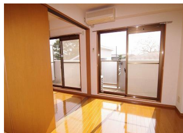
※写真は、302号室タイプ