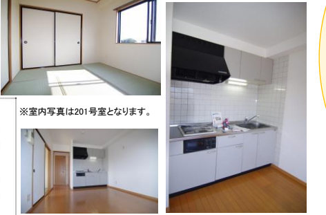
※室内写真は201号室となります。

201号室 退去済 家賃:54,000円 管理費:2,500円 メンテ保証料:600円 (緊急修理含む) (即入居可) 使用部分面積:43.12㎡