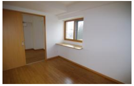
*室内写真は、603号室となります。

103号室 退去済 家賃: 57,000円 管理費: 3,000円 償却負担金: 880円 (即入居可) 使用部分面積: 40.50㎡