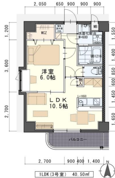
※現況と図面が異なる場合は現況有姿を優先します。